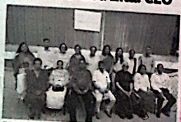
Chief Executive Officer South Goa Zilla Panchayat along with renowned Actor, Director, Producer and Psychiatrist Dr Mohan Agashe and others before screening of Zindagi Zindabad at Ravindra Bhavan Baina.