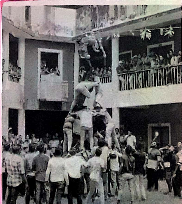
The students of MES College celebrated Janmashtami by breaking the 'Gahi Handi' in a colourful ceremony participated enthusiastically by students of diverse streams in the college.

Mormugao JN Box 26 th Aug to 16 th Sept 2019