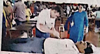
मुंबारीनगर : एम ई एस, महाविद्यालयात आयोजित केलेल्या रक्तदान शिबिरात सहभागी झालेले रक्तदाते.