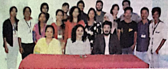
Resource persons and participants of the workshop