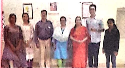
Students with the librarian and teachers