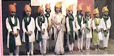
Students of People's Primary School, Panaji presenting a patriotic song on the occasion of 73rd Independence Day

Consumer welfare cell in collaboration with the department of Economics, MES College of Arts and Commerce, Zuarinagar conducted a one-day programme titled 'Consumers assert your rights and pursue remedies'. A series of competitions like essay writing, collage making, extempore elocution, ad mad show and street play competitions were organised. Around 70 students participated in the various competitions. Students of TYBA were adjudged winners while TY BCom were runners-up.