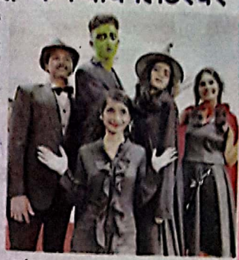
हुआरीनगर : एम.ई.एस. महाविद्यालयाच्या इंग्रजी विभागाच्या 'फन वीथ लिटरेचर' कार्यक्रमात सहभागी झालेले विद्यार्थी.