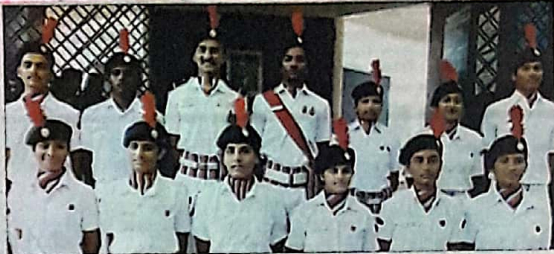
कारवार येथे नेहल युनिटच्या शिबिरामध्ये सहभागी झालेले एम.ई.एस. महाविद्यालये नेहल कॅडेट.