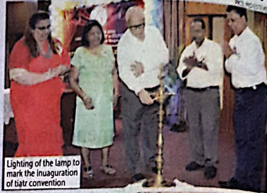
Lighting of the lamp to mark the Inauguration of tiatr convention