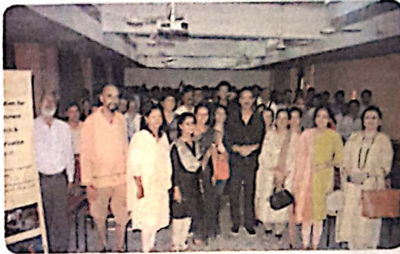
The august gathering at Kasturi lecture series

of the Kasturi lecture series. Wendell Rodricks' talk revolved around being a pluralist persona. He spoke about his early life and his foray into the world of fashion designing. He spoke about how being true to his roots helped him achieve more fame. He strongly suggested that if we love what we do then our job will be our hobby. He also spoke about how important it was to delegate work. He stressed on the importance of working for charity and how essential it is to help society and not to be afraid to fight for a cause that one believes in. The talk concluded with an interactive session between the guest, students and assembled public.