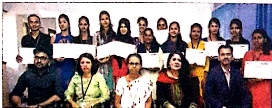
शिष्यवृत्तीप्राप्त विद्यार्थ्यांसोबत मान्यवर.

पणजी : आर्किटेक्चर कर्मकृत गद्यतील विद्यार्थ्यांचे उच्च शिक्षणाचे स्वप्न पूर्ण करण्याच्या हेतूने 'एनएसडीएल ई-गव्हर्नन्स' आणि 'प्रॉव्हिडेंट हाऊसिंग लिमिटेड'ने 'विद्यार्थी' अंतर्गत व्यासपीठांतर्गत शिष्यवृत्ती उपक्रम सुरू केला आहे. यासाठी गोंयातील एमईएस कला आणि वाणिज्य महाविद्यालय तसेच गोवा कॉलेज ऑफ आर्किटेक्चर या दोन महाविद्यालयांची निवड करण्यात आली आहे. या दोन्ही शैक्षणिक संस्थांमध्ये योग्यता शिष्यवृत्तीप्रदान सोहळा आयोजित करण्यात आला होता. यात एमईएस कला आणि वाणिज्य महाविद्यालयाच्या १३ तर गोवा कॉलेज ऑफ आर्किटेक्चरच्या १५ विद्यार्थ्यांना शिष्यवृत्ती प्रदान करण्यात आली. यामध्ये वर्ष २०१९-२०२० चा संपूर्ण शैक्षणिक वर्षाचा समावेश आहे. यावर्षी एनएसडीएल ई-गव्हर्नन्सचे मुख्य कार्यकारी अधिकारी