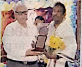
Awardee Rising Star of Sanvorcotto