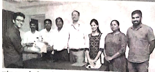
एमईएस कला आनी वाणिज्य म्हाविद्यालयाच्या कोंकणी विभागान आयोजीत केल्ले कोंकणी कविता सर्तींत जैतवंतक इनामां भेटयतना मानसत